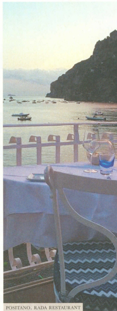
POSITANO. RADA RESTAURANT